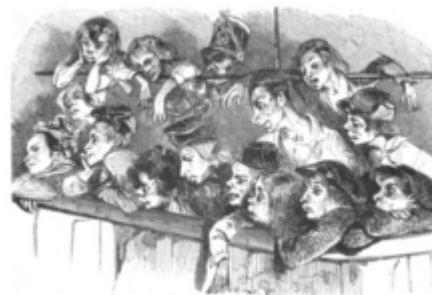
Раёк в театре «Фюнамбюль» (рисунок 1843 года)

Главные герои фильма — реальные исторические личности. Великий мим Батист Дебюро , или просто Батист (1796—1846), в 1819 году на сцене парижского театра « Фюнамбюль » переосмыслил образ Пьеро , создав образ отвергнутого несчастного влюблённого. Фредерик Леметр (1800—1876) — не менее знаменитый актёр, легенда и реформатор французского театра. Пьер Ласенер (1803—1836) — известный поэт, вор и убийца.