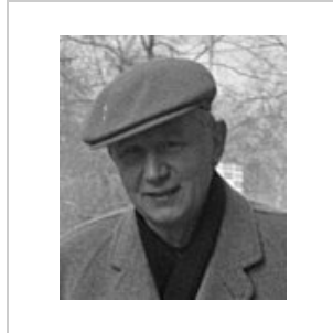
Helmut Käutner 1960