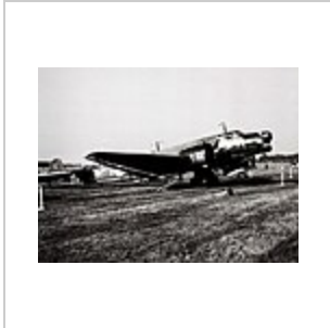
Eine Junkers Ju 86 K der schwedischen Luftwaffe (Foto von 1976)

Veröffentlicht wurde der Film zudem in Kanada, Griechenland, Polen, Rumänien, in der Sowjetunion, in Spanien und im Vereinigten Königreich. Der internationale Filmtitel lautet The Devil's General . Filmjuwelen gab den Film innerhalb der Reihe „Juwelen der Filmgeschichte“ am 6. April 2018 auf DVD heraus. Die Blu-ray von Filmjuwelen präsentiert den häufig in gekürzter Fassung gezeigten Film in voller 120-minütiger Länge sowie den Trailer und enthält ein 16-seitiges Booklet mit Zusatzinformationen. [10][11]