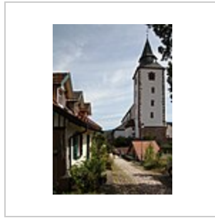
Место съёмок экстерьера дома Пихлера возле церкви Богоматери.

Премьера состоялась 18 августа 1933 года в берлинском Титания-Паласт . [1] Два дня спустя газета Berliner Morgenpost сообщила о «очень дружеском приеме» со стороны премьерной публики и «много аплодисментов», «когда перед кулисами появились двуногие и четвероногие актеры». [5]