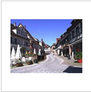
Гернсбахер Марктплац, место выступления Амадори.