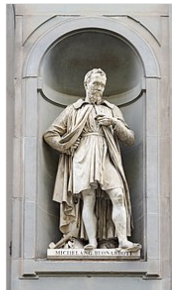
Памятник Микеланджело во Флоренции

В кинолистах Паймана резюмировалось: «Срез жизни и творчества мастера предлагается через произведения, без какого-либо актерского воплощения; дополненные картами и современными изображениями, с ясновидящим фотоаппаратом, при различном освещении,... симфонической музыкой» [3].