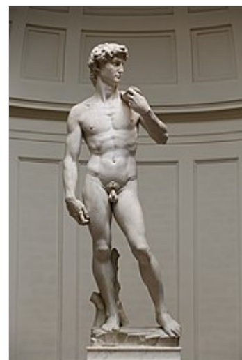
Статуя Давида Микеланджело (Академия изящных искусств, Флоренция)