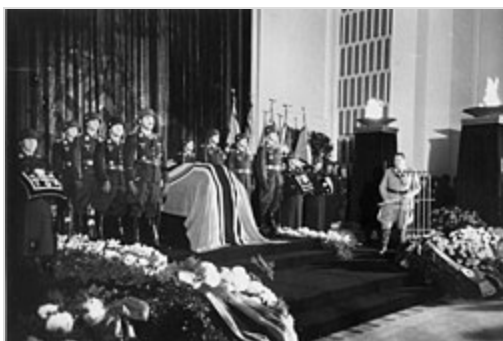
Похороны Эрнста Удета. Справа от гроба Герман Геринг

В 1930-х годах проживал и выступал со своим авиашоу в США. Получил известность благодаря своему неповторимому пикированию. Геринг посещает его шоу, где ему в голову приходит возможность использования такого пикирования в военных целях. Он уговаривает Удета вернуться в Германию и работать в люфтваффе . После нескольких отказов Удет согласился и с 10 февраля 1936 года получил должность инспектора истребительной и бомбардировочной авиации, а 9 июня того же года был назначен в техническое управление Министерства авиации, возглавляемое Мильхом , где курировал люфтваффе. В 1939 году стал генерал-инспектором