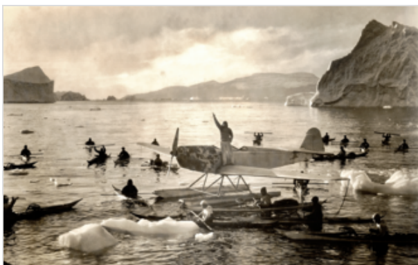
Эрнст Удет в фильме Арнольда Фанка «SOS. Айсберг!»

В 1920-е годы Эрнст Удет снялся в ряде фильмов. Наиболее известный художественный фильм с его участием — «Белый ад Пиц Палю» (нем. "Die weiße Hölle vom Piz Palü" ), снятый режиссёрами Арнольдом Фанком и Георг Вильгельм Пабст в 1929 году. В 1933 году вышел фильм «SOS. Айсберг!» Арнольда Фанка , в котором Эрнст Удет сыграл самого себя [1] .