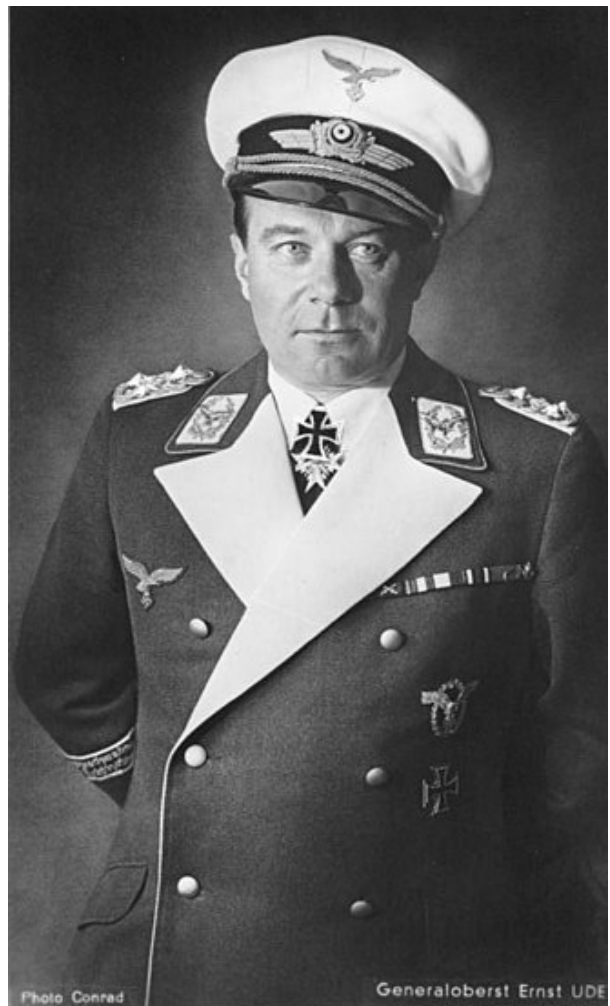
генерал-полковник Эрнст Удет. 1940 год