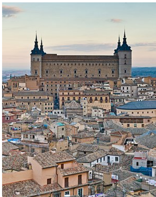
Алькасар в современном Толедо

Основной конфликт: Гражданская война в Испании